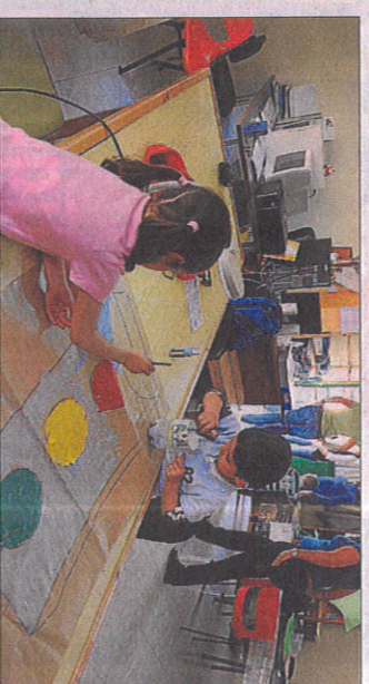
Dos veces por semana. Los lunes y jueves 12 niños de Primaria del CEO Rey Juan Carlos I de Valleseco asisten a clases de educación vial, donde montan en bicicleta, se familiarizan con los coches y aprenden los señales de tráfico.

Jueves 25 de marzo 2010 Suplemento mensual Canarias 7